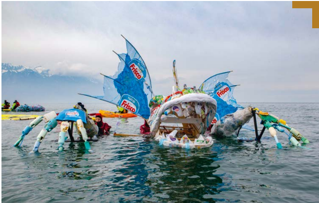
Un monstre de plastique construit par Greenpeace devant le siège de Nestlé, en avril 2019.

→ et environnementaux. Et les individus peuvent être tentés de se replier sur eux-mêmes, de se concentrer sur leurs besoins « ici et maintenant », sur la sécurité financière à court terme, par peur de perdre en confort. Les campagnes en prévision des votations jouent beaucoup sur cette peur. Certes, nos intérêts personnels ont une valeur. Mais il est important que nous regardions toutes et tous plus loin que le bout de notre nez.